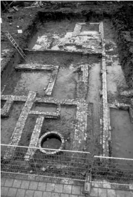
Opraving bij de Achterweg in de gemeente Tiel. Het rijksbeleid geeft aan dat archeologische resten bij voorkeur in situ (in de bodem) behouden worden bij ruimtelijke ontwikkelingen.