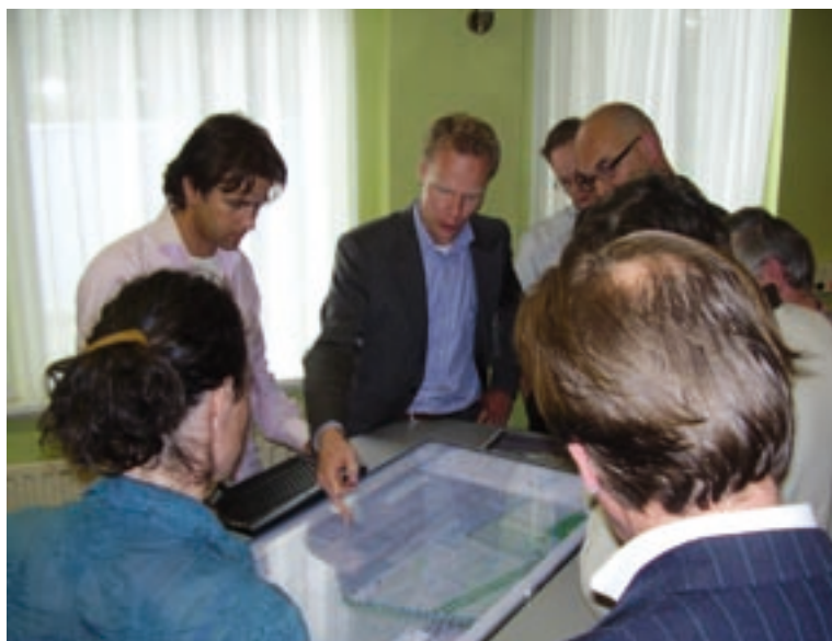
Interactieve planvorming met maptables.

Na een toets van het VKA aan de ambities en doelen voor het Park, bleek dat het VKA voldoet. Er is voldoende openbaar toegankelijk gebied gecreëerd en er is maximaal invulling gegeven aan de recreatieve ambities. Daarnaast