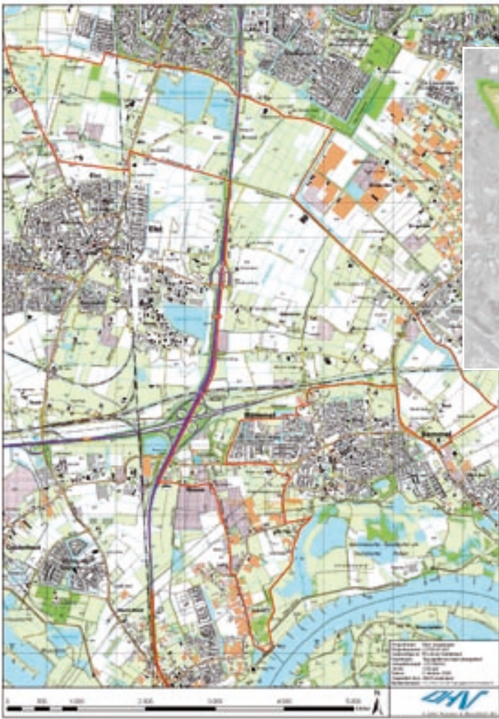
Het plangebied voor Park Lingezegen. In de inzet de verschillende deelgebieden.

H et toekomstige Park Lingezegen ligt centraal in de stadsregio Arnhem-Nijmegen. Deze regio is de laatste decennia in een hoog tempo verstedelijkt. De twee steden vormen de noord- en zuidgrens en zijn in het recente verleden de rivier overgestoken. Hiermee is de verstedelijking zich gaan concentreren in het middengebied: het grondgebied van de gemeenten Lingewaard en Overbetuwe. Arnhem bouwt inmiddels aan de Vinex-wijk Schuytgraaf en ten noorden van de Waal verrijst de Vinex-locatie De Waalsprong. Ten oosten van de kern Elst wordt Westeraam ontwikkeld. De Vinex-wijken Klein Rome en Klaverkamp bij Bemmelen zijn reeds gerealiseerd. Wanneer deze nieuwbouwplannen zijn afgerond, wonen er straks circa 160.000 mensen tussen Arnhem en Nijmegen. Naast de stedelijke uitbreidingen leggen infrastructurele werken als de Betuweroute en de A325 een aanzienlijke claim op het huidige landschap.