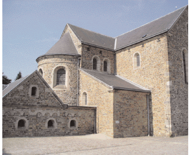
Zeldzaam: Graf van koning Zwentibold (Kloosterkerk in Susteren)

uitspraken van de Raad van State waarin werd bepaald dat 'archeologische waarden' vallen onder het begrip milieu (Wm: nadelige gevolgen voor het milieu: RvS 4-12-02) maar dat 'cultuurhistorische waarde' (d.d. 13-11-02) geen betrekking heeft op het belang van de bescherming van het milieu. Overigens is dit voor de m.e.r. minder relevant. Immers, daarvoor geldt een veel ruimere reikwijdte ('de bescherming van esthetische, natuurwetenschappelijke en cultuurhistorische waarden') dan voor de Wm-vergunning.