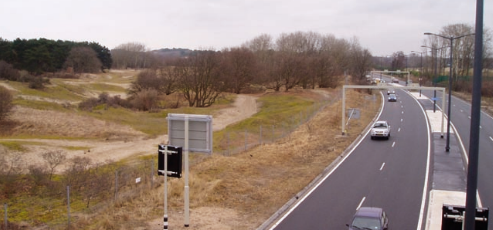
Het Natura 2000-gebied Meijndel en Berkheide grenst direct aan de Landscheidingsweg, die als gevolg van de realisering van de A4DS (14 km verderop) extra verkeer te verwerken zal krijgen.

tussen een situatie met of zonder A4DS. Deze zone van 200 meter is daarom beschouwd als het invloedsgebied van de ingreep. Binnen deze zone is volgens de gegevens uit het beheersplan overal sprake van een kalkhoudende duinvaaggrond. Het habitattype 2130 (grijze duinen) behoort hier daarom tot het kalkrijke subtype A met een kritische depositiewaarde van 1240 mol/ha/jr. Tabel 2 laat zien hoe de berekende depositie zich verhoudt tot de achtergrond- en kritische depositie.