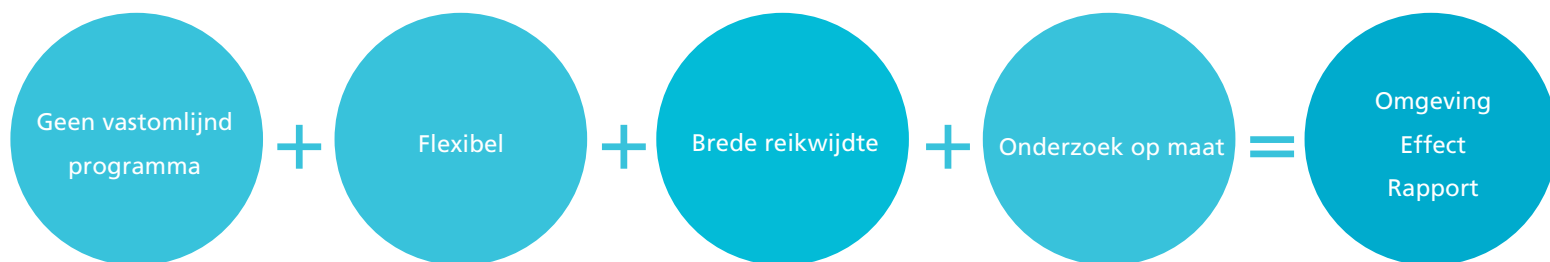
Figuur 2. Bundeling van voorwaarden in Omgevingseffectrapport Binckhorst.

van het bestemmingsplan met verbrede reikwijdte had hier juist een extra meerwaarde uit de m.e.r. kunnen worden gehaald. Kanttekening hierbij is wel dat de milieueffecten (ook gezien de ligging van het plangebied) relatief beperkt waren. Een ander project in Almere, Weerwater/Floriade, is thans nog in de planvorming. Ook hier worden de alternatieven vormgegeven door middel van een worst-case-benadering met enkele scenario's. Interessant is te zien hoe hier de borging en monitoring wordt vormgegeven.