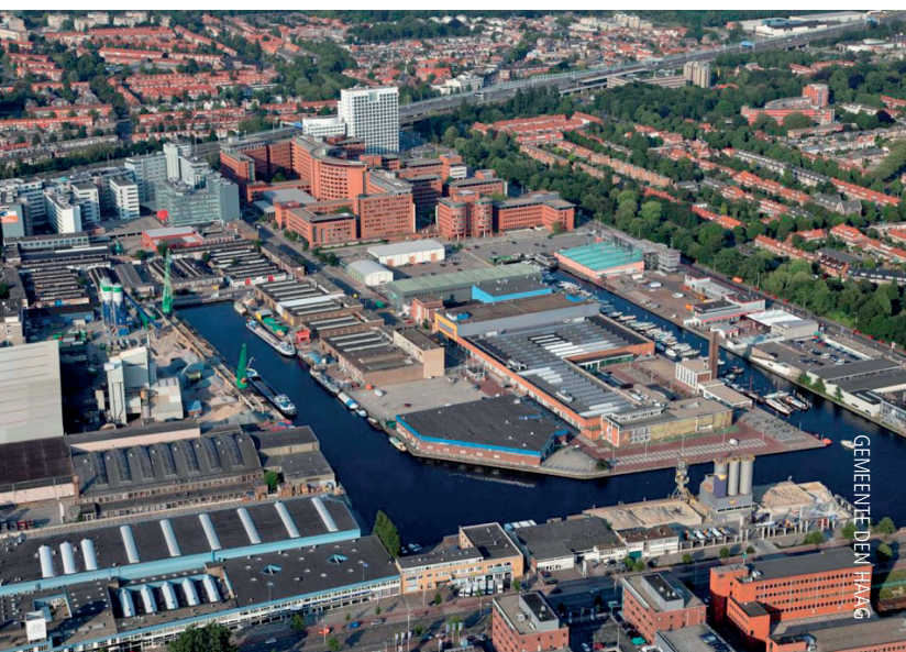
Het verouderde bedrijventerrein Binckhorst, nabij het centrum van Den Haag.

De plannen en projecten die straks optimaal gebruik willen maken van flexibiliteit, saldobenadering en experimenteerregelingen, vragen wel om een andere houding van m.e.r. M.e.r. zal bij deze plannen en projecten moeten proberen de aanwezige onzekerheid vorm te geven middels scenario's, bandbreedten en duidelijke leemten in kennis voor eventueel vervolgonderzoek. Op structuurvisieniveau is hier al ervaring mee. Daar staan vragen centraal over de impact van een bepaalde beleidsdoelstelling of het uitpakken van diverse scenario's voor geformuleerde doelstellingen. Ook voor projecten zijn diverse voorbeelden beschikbaar waar is omgegaan met onzekerheid of onduidelijkheid over het programma. Hierbij moeten dan in het moederbesluit wel diverse voorschriften worden opgenomen, om bijvoorbeeld te zorgen dat een te hoge geluidsbelasting via een dove gevel of via overdrachtsmaatregelen en/of bronmaatregelen wordt voorkomen.