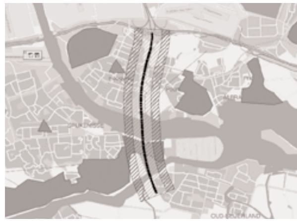
4. Idem met nieuwe woningbouwlocaties.