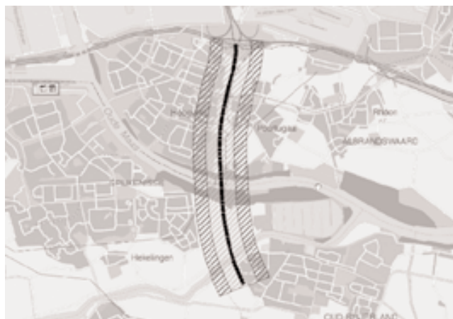
2. Idem met Vogel- en Habitatrictlijngebieden.