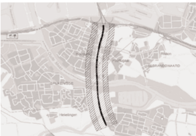
1. De nieuw aan te leggen A4-Zuid met milieu-Invloedsfeer (300-600 meter).

RR2020 laat zich kenmerken door een duidelijke mobiliteitsstrategie gericht op (1) betere benutting van het OV-netwerk door verdichting rond stations en metrohaltes, en (2) uitbreiding van het OV-netwerk. De kwaliteit van het OV-netwerk neemt dan ook toe. Deze toename zal naar verwachting het effect van de verdunning in herstructureringsgebieden (een van de planelemen-