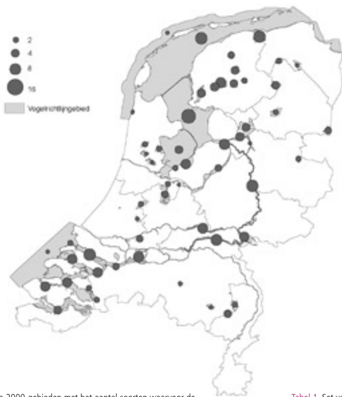
Figuur 1. Overzicht van Natura 2000-gebieden met het aantal soorten waarvoor de gebieden op basis van de nachtelijke slaapplaatsfunctie zijn aangewezen.